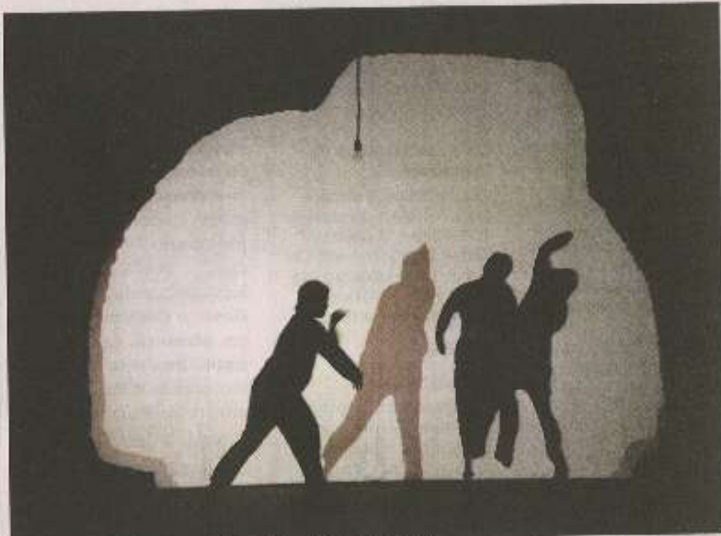
Pas facile d'apprivoiser une ombre...

Car si la forme est très technique, le fond se veut avant tout poétique. On a beau travailler avec l'Agence nationale pour la recherche à