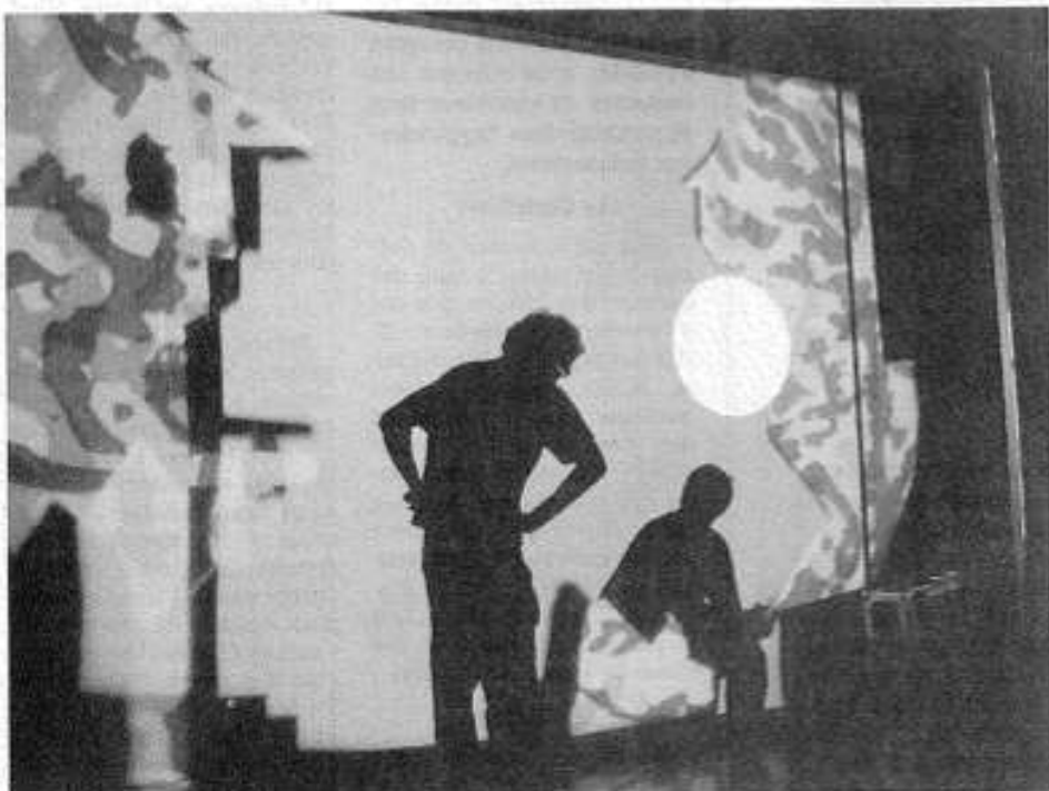
Ombres Escales à La Filature. (Document remis)

L'idée consiste à explorer les rapports entre un sujet et son ombre. Avec la vidéo, la lumière, le son et la danse comme outils, l'auteur compose alors en direct un dialogue entre le corps d'un danseur et son reflet. Ensemble,